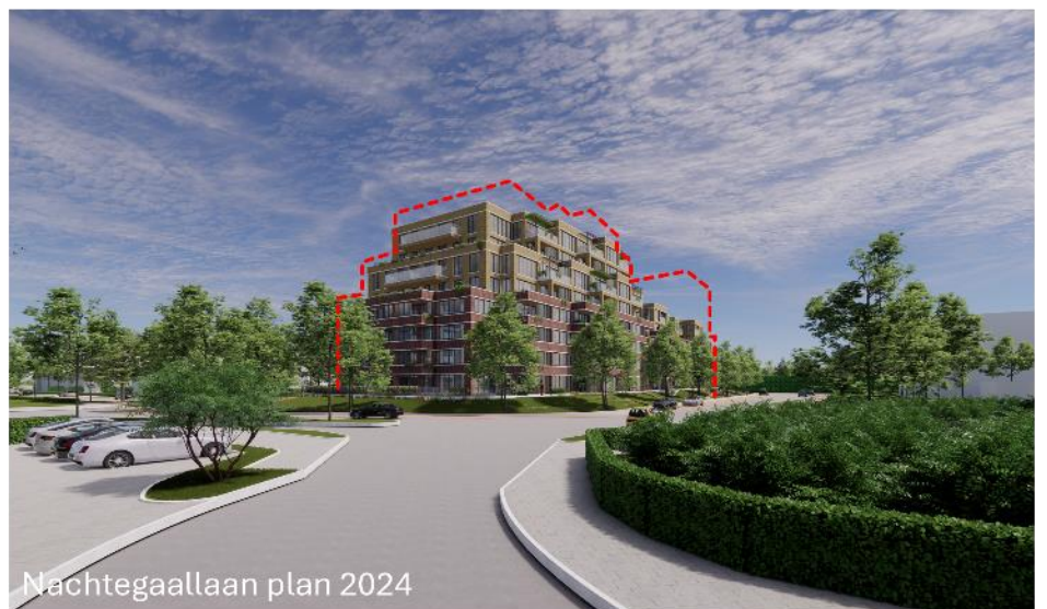
Nachtegaallaan plan 2024