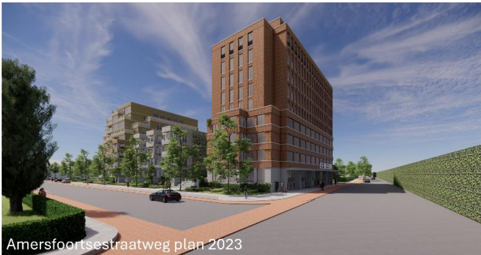
Amersfoortsestraatweg plan 2023

Vergelijk plan 2023 of bestaande situatie (links) met plan 2024 (rechts):