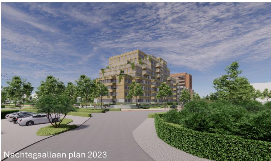
Nachtegaallaan plan 2023