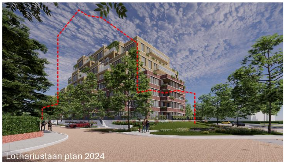
Lothariuslaan plan 2024