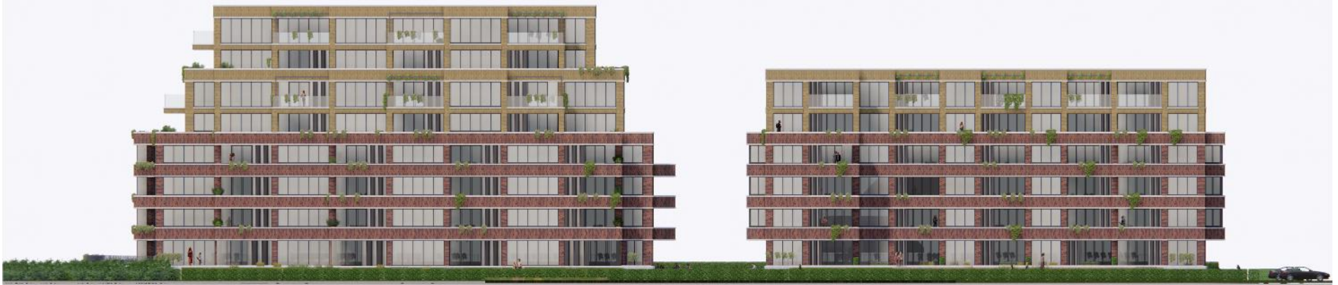
Aanzicht vanaf Ceintuurbaan