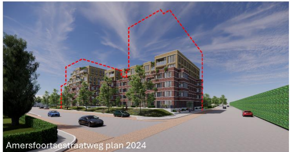
Amersfoortsestraatweg plan 2024